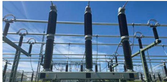
6 In 07368 Remptendorf: Umspannwerk Umspannwerkstraße