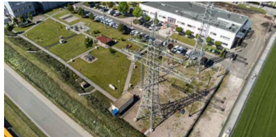
4 In 99087 Erfurt: TEAG Akademie/Ausbildungszentrum Schwerborner Straße 30