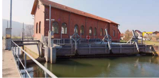
2 In 99830 Falken: Wasserkraftwerk Mühlstraße